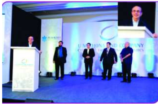
Adi Godrej Speaking at Function

New generation consolidating & expanding the efforts of Kirit Lapsia & Jayant Lapsia