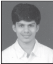
દિપ કિરીટ દંડ ડોંબિવલી B.E. (Comp)