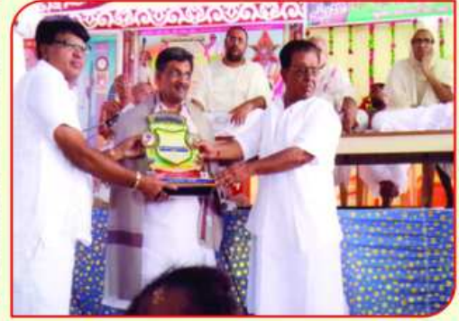
અનુમોદના - શોભાયાત્રાની ઝલક

કસ્ટમ હાઉસ એજન્ટરૂપે ૬૨ વર્ષથી ગોદરેજ સોપ્સ, હિન્દુસ્તાન યુનિલિવર્સ, વી.વી. એફ લિ., અને તાતા ઓઇલનું કામ સંભાળી જ્ઞાતિને બિઝનેસ વર્લ્ડમાં ગૌરવ અપાવનાર